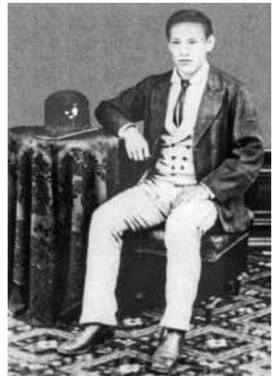
石川区長時代の河野広中