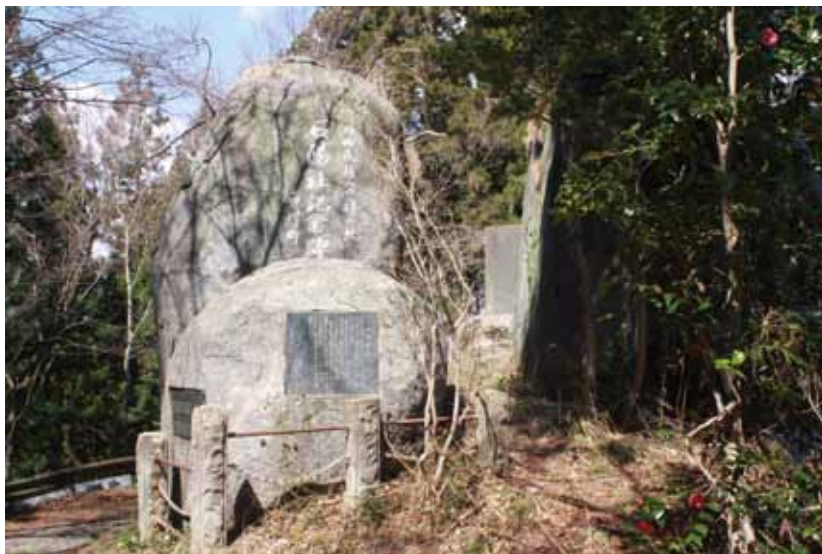
石尊山に建つ明治100年記念建立の「石陽社記念碑」