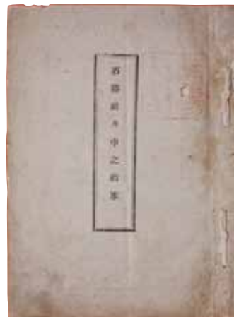
石陽社々中之約束（渡辺実氏蔵）

当時の福島県では公選議員による県民会（現在の県議会）の開設が進められ、1878年6月、全国に先駆けて県会が開かれました。これらの動きが刺激となって、有志会議に代わる石陽社を結成することになりました。これまでの有志会議の書類は1878